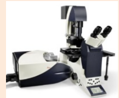
“ Leica TCS SP8 ”